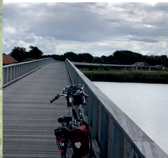
Die längste Fahrrad- und Wanderbrücke Europas

Anmeldung bis 20.06.2023 bei der Tourenleitung